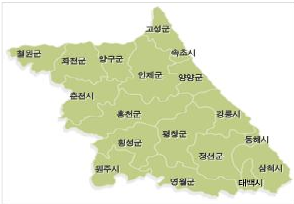
<평창군의 위치 및 행정구역>